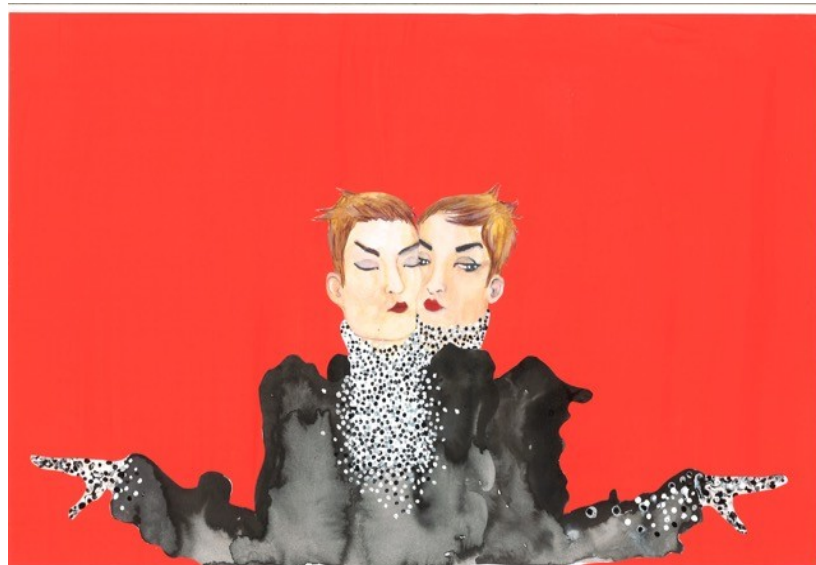
Illustration de Marc Salvan-Guillotin

Samedi 20 juin - salle des Actes de la Sorbonne (Paris)